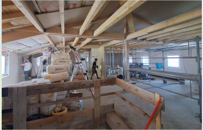
Pose des premières cloisons des futures chambres d'hébergement

Pour cette raison, les accès piétons et vélos seront rétablis en amont des travaux en passant dans le pré comme cela avait été organisé l'été dernier ; la sortie côté Cornimont sera toutefois améliorée afin d'éviter la zone humide et boueuse qui avait été constatée à l'automne 2025.